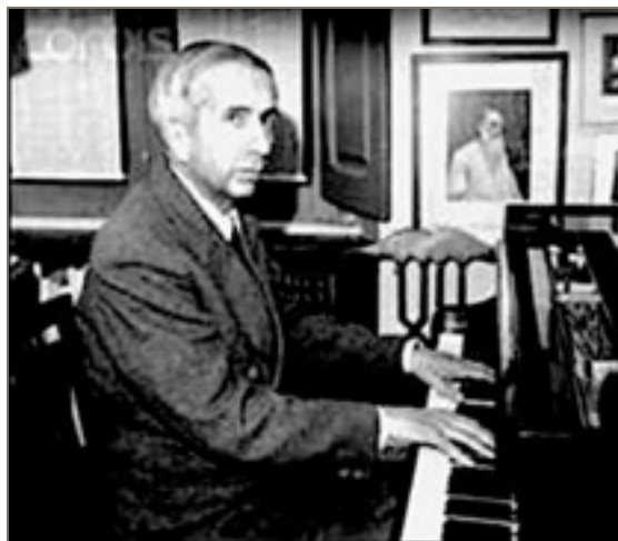
Alfredo Casella (1883 - 1947)